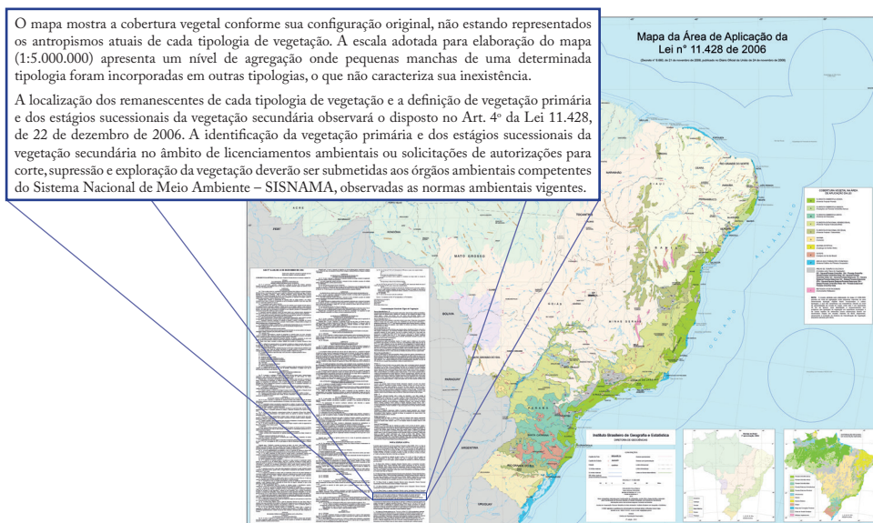
Figura 1: IBGE. Mapa da área de aplicação da Lei nº 11.428 de 2006. 2. ed.

Contudo, a legenda do mapa adverte sobre as limitações temporais (o mapa procura representar a configuração original do bioma, sem antropismos) e espaciais (a escala utilizada provoca a agregação de pequenos fragmentos em outras tipologias, o que não caracteriza sua inexistência). Na própria legenda, adverte-se que a caracterização da tipologia da vegetação sempre dependerá de estudos específicos adicionais, em conformidade com as regulamentações do Conselho Nacional do Meio Ambiente (Conama). Ou seja, a perícia geográfica é fundamental para a constituição de direitos.