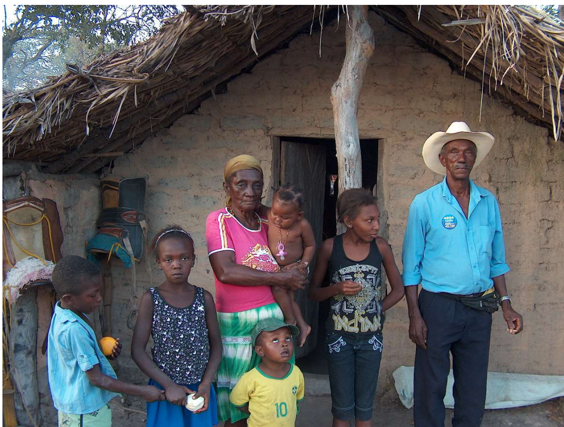
Projeto GEOAFRO. Família quilombola. Território Kalunga, Cavalcante – GO. 2011

REPÓRTER: OSWALDO BRAGA DE SOUZA BRASÍLIA, 08 DE JUNHO DE 2016